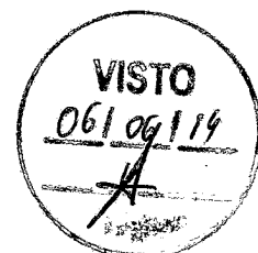
ROMEU ALDIGUERI DE ARRUDA COELHO PREFEITO MUNICIPAL

Paço da Prefeitura Municipal de Granja/Ce, aos 06 dias do mês de junho de 2014.