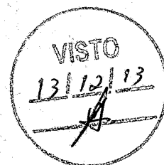
ROMEU ALDIGUERI DE ARRUDA COELHO PREFEITO MUNICIPAL

Paço da Prefeitura Municipal de Granja/Ce, aos 13 dias do mês de dezembro de 2013.