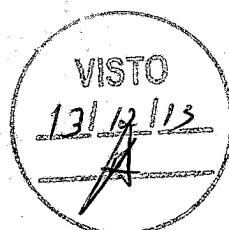
ROMEU ALDIGUERI DE ARRUDA COELHO PREFEITO MUNICIPAL

Paço da Prefeitura Municipal de Granja/Ce, aos 13 dias do mês de dezembro de 2013.